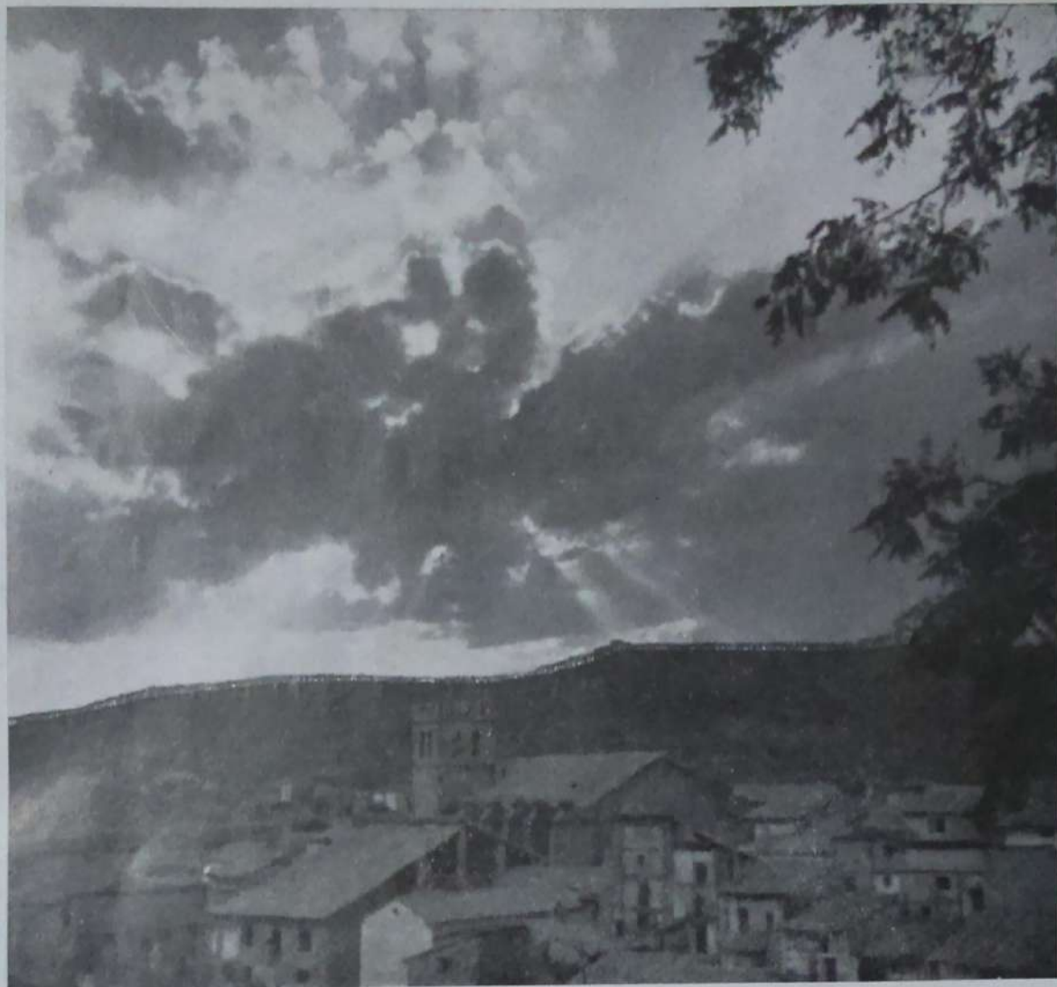
VISTA PARCIAL DE MORA DE RUBIELOS