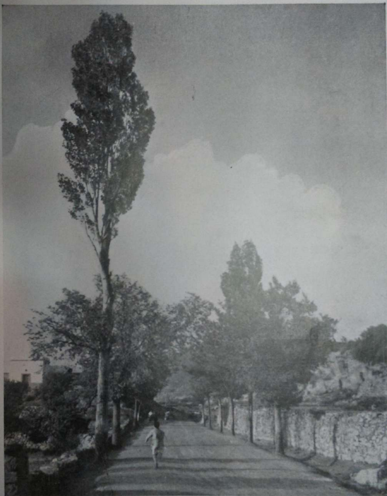
CARRETERA DE MORA DE RUBIELOS